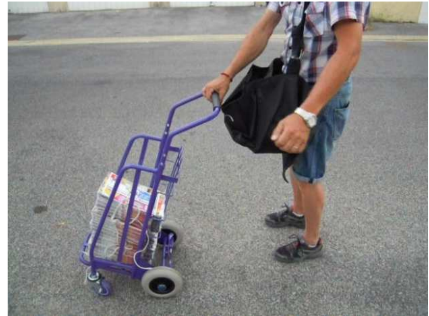
Chariot de distribution déployé après l'intervention