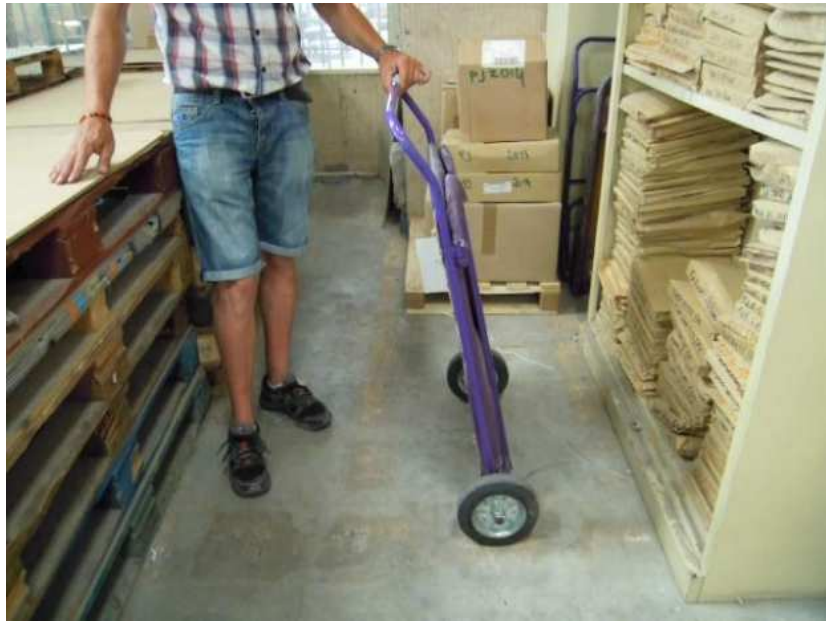
Chariot de distribution utilisé par opérateurs avant l'intervention